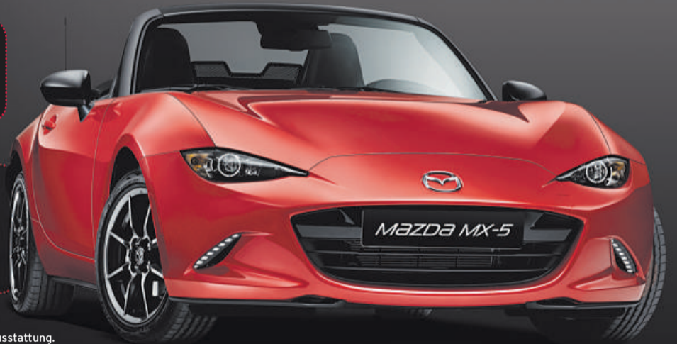
Abbildung zeigt Fahrzeuge mit höherwertiger Ausstattung.